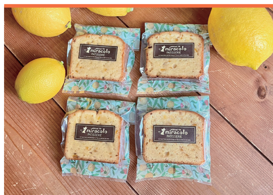
非加熱天日塩、焼菓子 えしかるや®ミラコロ

非加熱天日塩「ミラコロそと」と、白砂糖不使用、こだわりの材料で作った古代小麦の焼き菓子です。