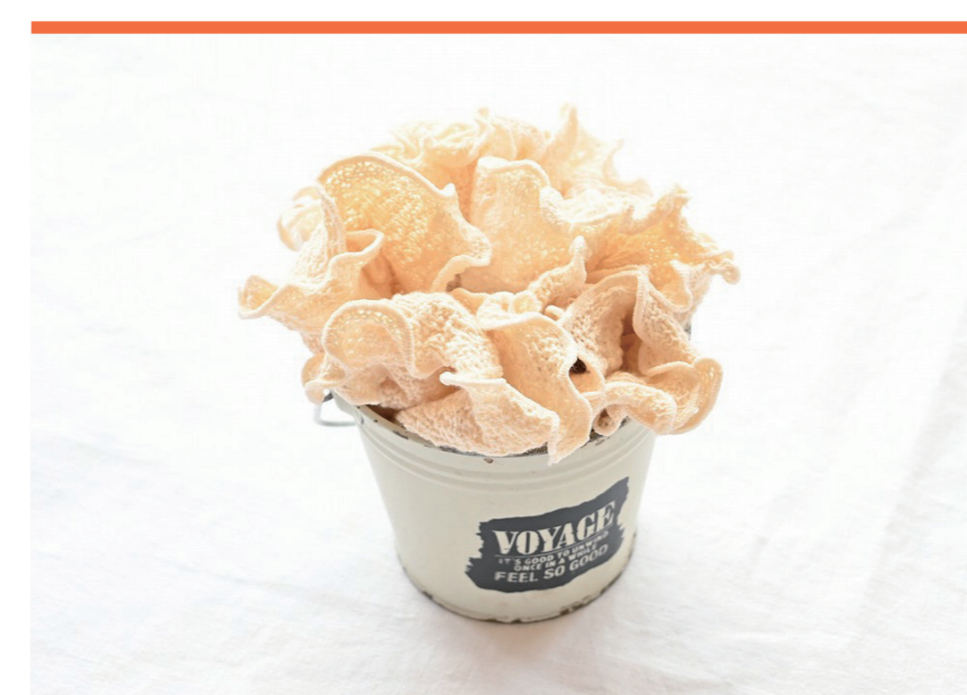
オーガニックコットン 村上メリヤス

農薬・化学肥料不使用、米糠のみで栽培されたえごまを使い、低温圧搾でじっくり作られた「えごま油」です。