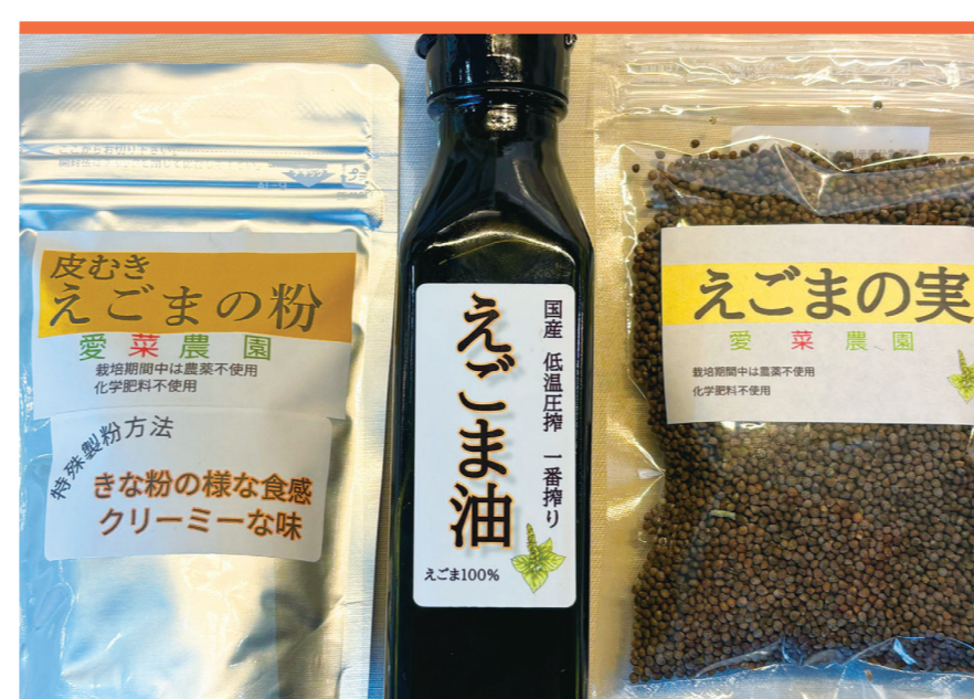
えごま油 愛菜農園 大阪河内えごま

インド伝承医学「アーユルヴェーダ」に基づいて配合されたオリジナルスパイスと、米粉ヴィーガンスイーツです。