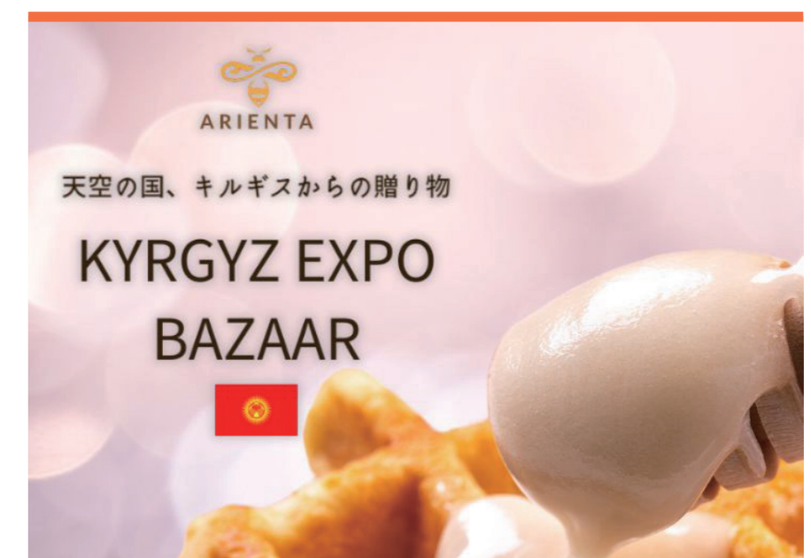
キルギスハニー キルギスエキスポバザール

国産・無農薬栽培の果物で作った、旬のおいしさがギュッと詰まった手作りの無添加ジャムとソースです。