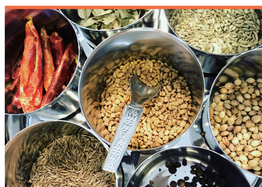
オリジナルスパイス アーユルヴェーダ食堂

大阪・関西万博で話題となった「白いはちみつ」など、無農薬・非加熱・無添加の生はちみつ、キルギスハニーです。