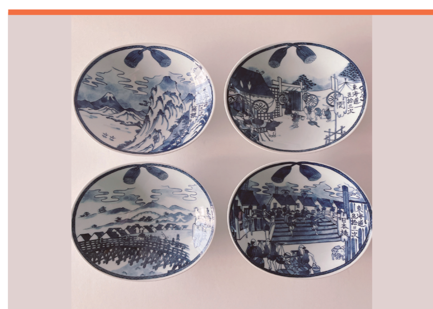
雑貨、古物、お菓子 都度、

非加熱天日塩「ミラコロそと」と、 白砂糖不使用、こだわりの材料で 作った古代小麦の焼き菓子です。