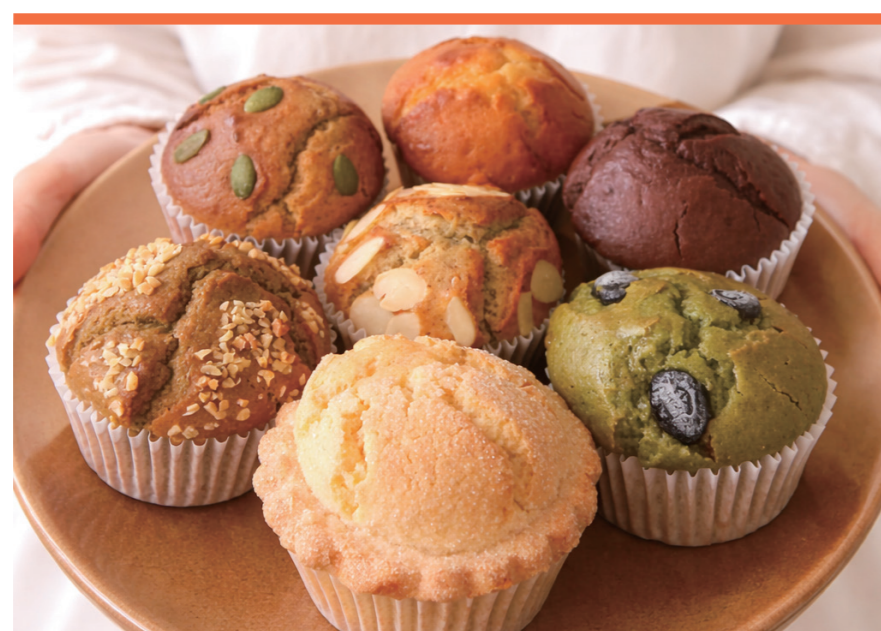
米粉のマフィン 米粉のマフィン屋 cucuri

“がんばる毎日に、こころゆるむひとときを。” ひとくち食べると思わず笑みがこぼれる、 そんなやさしいマフィンをお届けします。