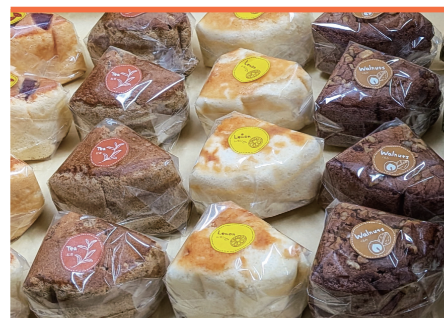
焼き立てシフォンケーキ シフォンケーキの店プロスパー

さつまいもや葉野菜を中心に栽培。農 業の未来を明るくしたいという想いから、 “食”と“農”をリアルにお届けします。