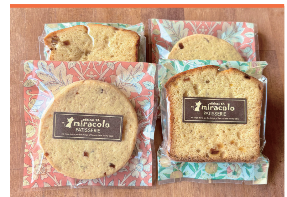
非加熱天日塩、焼菓子 えしかるや®ミラコロ

油脂類や乳、ハチミツ不使用。植物 由来の甘味料(ラカン)を使った体に やさしいシフォンケーキです。